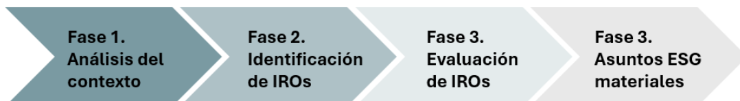
Ilustración 1. Fases del análisis de Doble Materialidad.

El análisis de Doble Materialidad ha integrado cuatro fases principales: